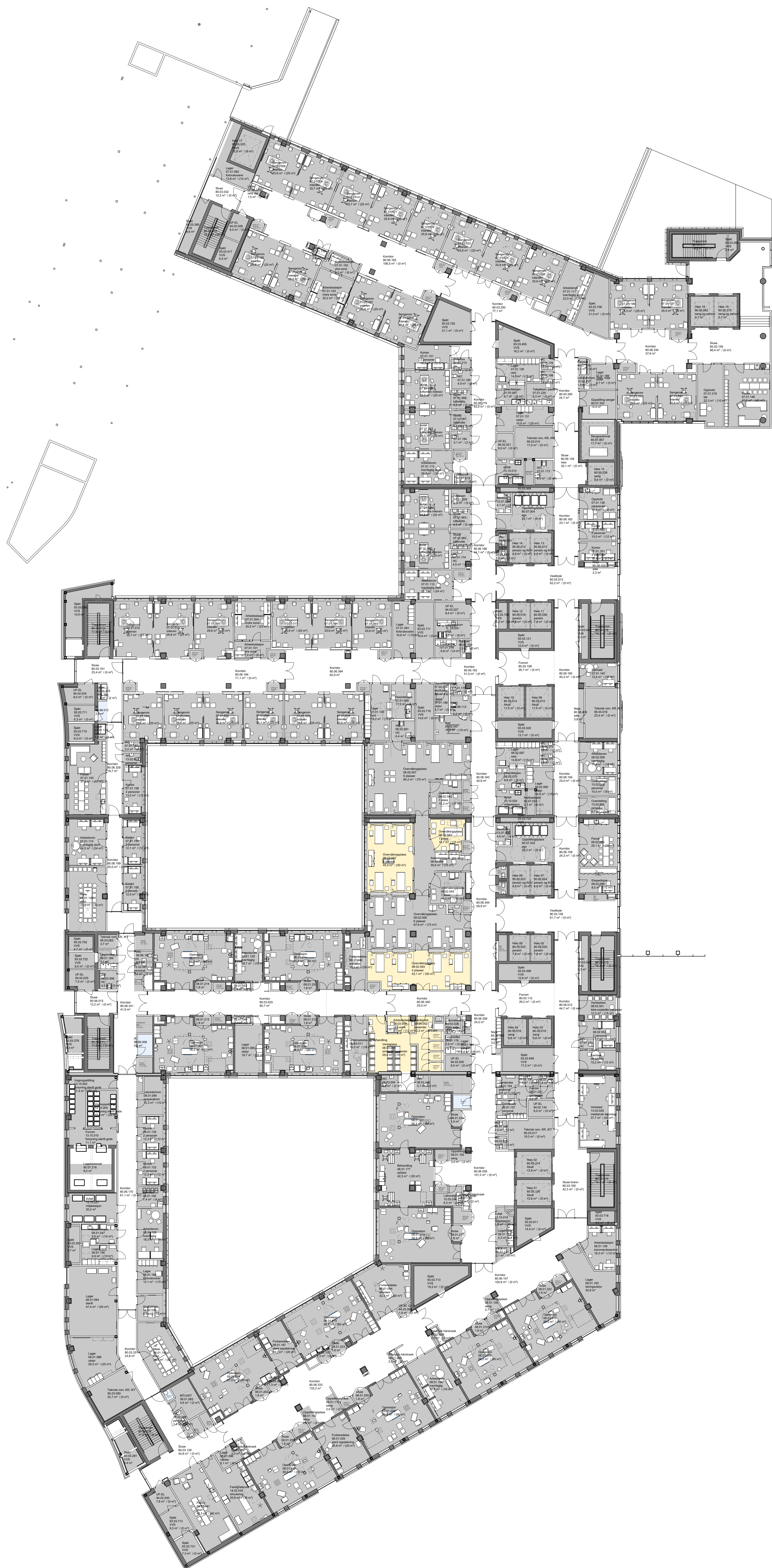
Oversiktstegning medvirkningsmappe F3